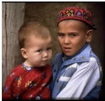
土库曼斯坦的土库曼人 穆斯林 427 万 基督徒 0.05%

全球近三分之二的人口都是功能性文盲。他们急需接受读写培训。我们可以利用媒体，口口相传和讲故事作为策略性的宣教工具。