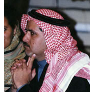
说纳吉迪语的沙特阿拉伯人。穆斯林 1200 万，基督徒 0.6%