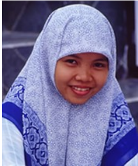
印度尼西亚的马都拉人 逊尼派穆斯林 857 万 基督徒 0.02%。

全球大约有 16,300 个族群，其中 6,600 个族群至今只有不到 2% 的基督徒，这意味着全世界的族群中，40% 都是福音未及之民。