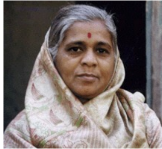
印度马拉塔人 印度教教徒 2865 万， 基督徒占比 0.0%。

全世界人口中超过 82% 的人已经拥有自己母语的新约圣经译本。然而剩下近 18% 的人仍然需要 2,500 种以上的译本。圣经翻译机构希望在 2025 年之前启动所有这些语言的圣经翻译。