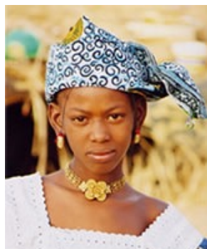
几内亚的富塔贾隆人 逊尼派穆斯林 510 万 基督徒 0.01%

全世界大约 90% 的基督徒外展事工 / 福音事工都把福音已及地区的挂名基督徒当做传福音对象。相反，在每百万福音未及的穆斯林中，宣教士的人数却不到三个。