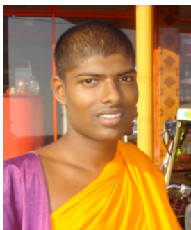
斯里兰卡的僧伽罗人 佛教徒 1126 万 基督徒 0.0%

在许多国家里迫害基督徒的事情频频发生，例如：沙特阿拉伯、苏丹、索马里、摩洛哥、缅甸、伊朗、利比亚、朝鲜、阿尔及利亚、也门、越南、老挝、埃及、中国。今年殉道的基督徒将超过 200,000。