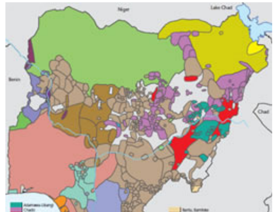
Figure 2 尼日利亚有超过 520 个不同的族群， 每一个族群都需要植堂运动。