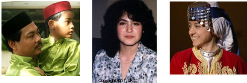
在东欧及欧亚大陆仍有224个福音未及之族群!

-求神将祂属天的丰盛, 藉由那些全心向着祂的人倾倒出来; 丰富预备各种资源, 使好消息在福音未及之处传扬。