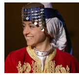
在西非和中非仍有502个福音未及之族群!