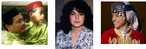
南亚仍有2961个福音未及之族群!