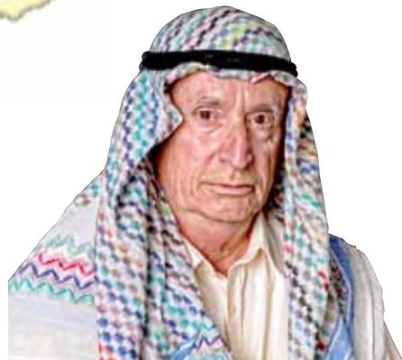
中東和北非的老年人口