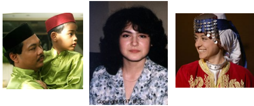
东南亚仍有701个福音未及之族群!

-求神帮助当地信徒运用创意将福音和神的真理传递出去, 如同信徒们会使用诗歌与说故事传福音, 借由他们所熟悉的方式说明盼望与救恩的永恒信息。