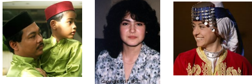
在北美和加勒比海地区仍有137个福音未及之族群!

-求神使北美的信徒活出基督的样式,成为生命的信息,他们所活出来的生命值得人效法,成为周围福音未及之民活生生的见证。